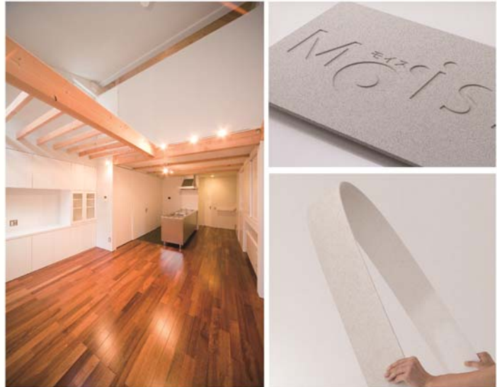
<実物モイス展示による吸湿性能体験> (イメージ)