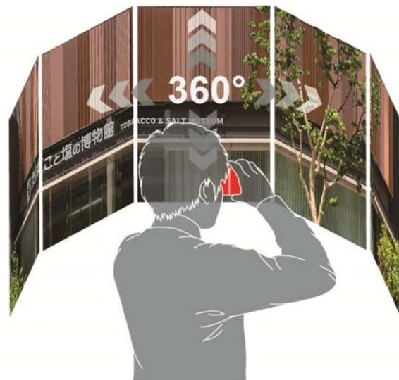
〈VRゴーグルを用いた物件見学体験〉（イメージ）