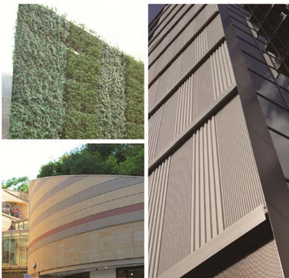
〈各種メースの実物サンプル展示〉（イメージ）